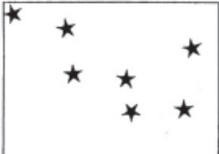
(Resposta semana que vem)